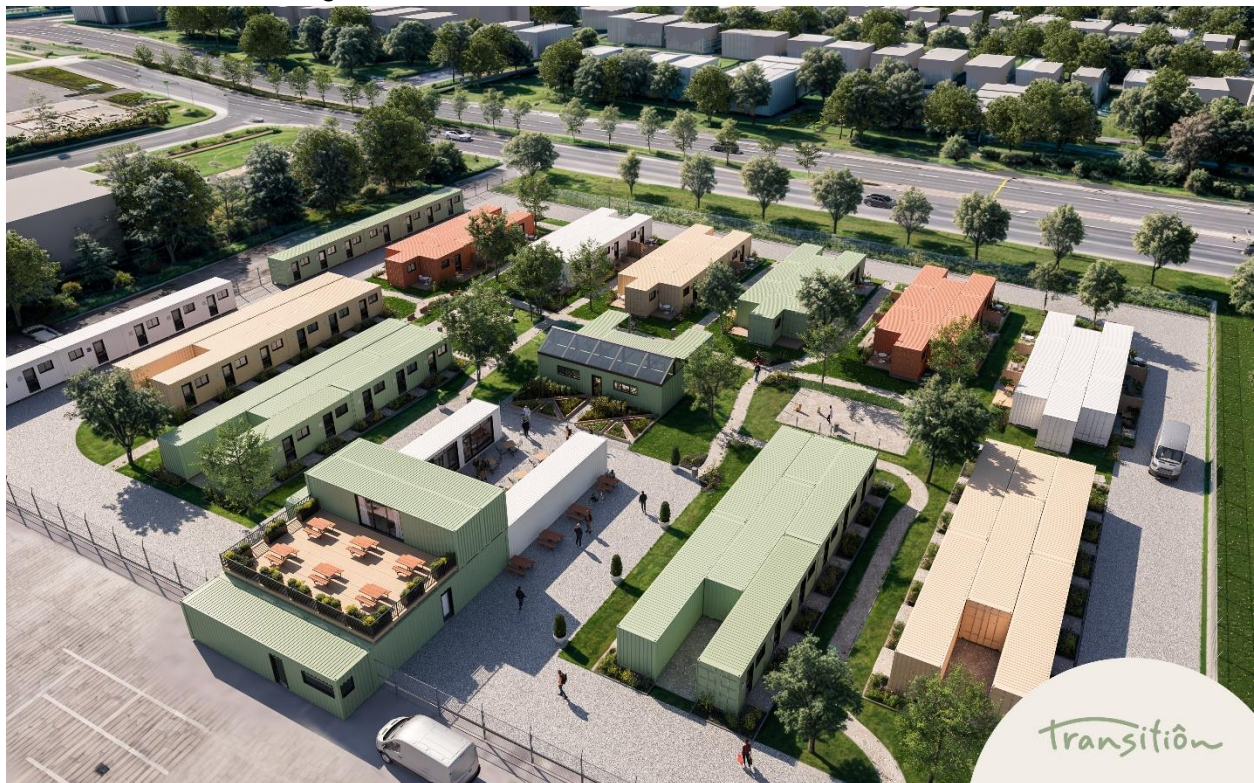
Vue d'ensemble du Village